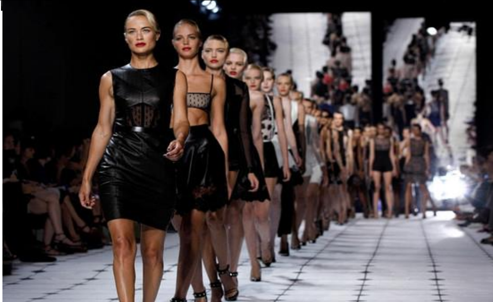
Fashion - Week