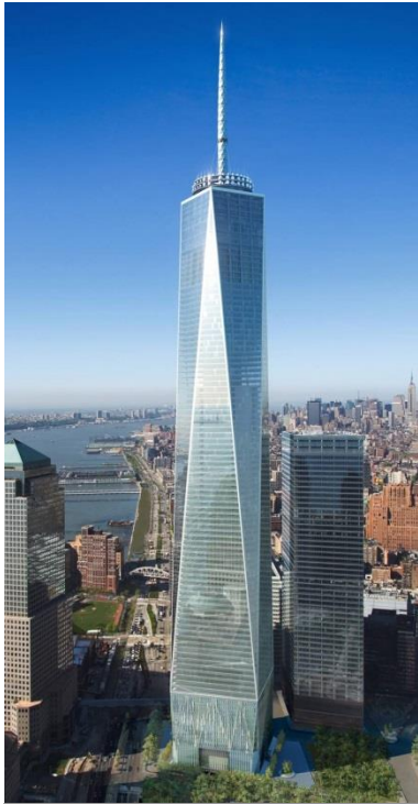
One World – Trade - Center