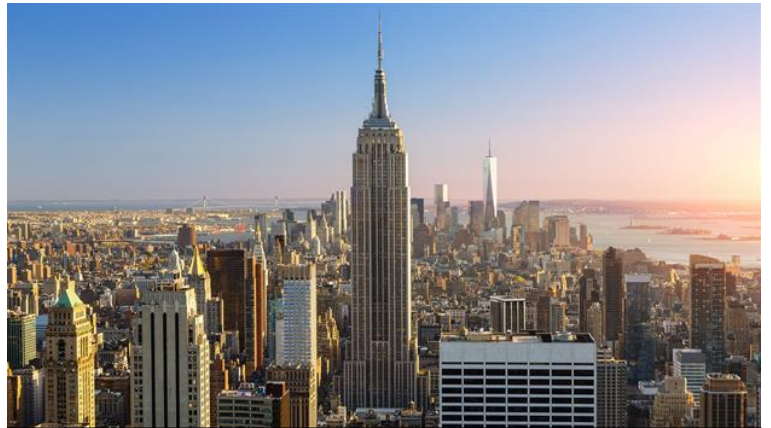
Empire State Building